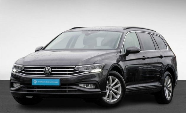
Hülpert VZ GmbH Volkswagen Zentrum Dortmund