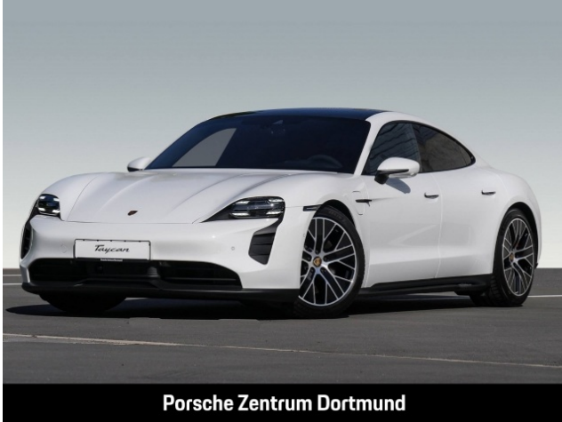
Porsche Zentrum Dortmund