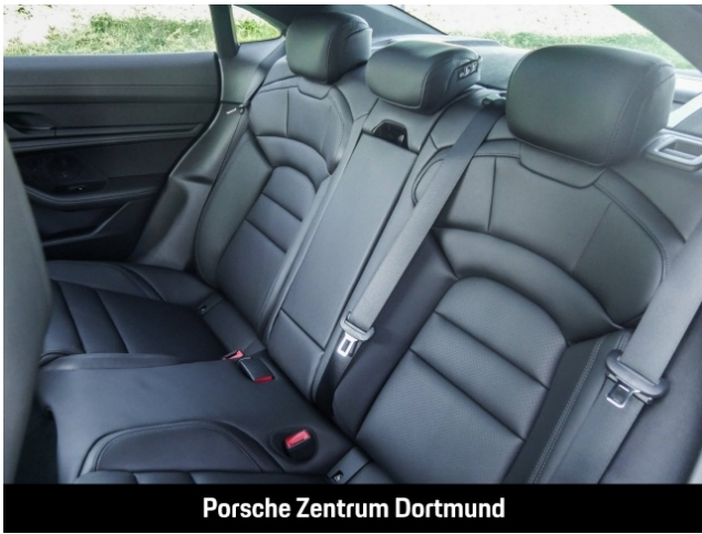
Porsche Zentrum Dortmund