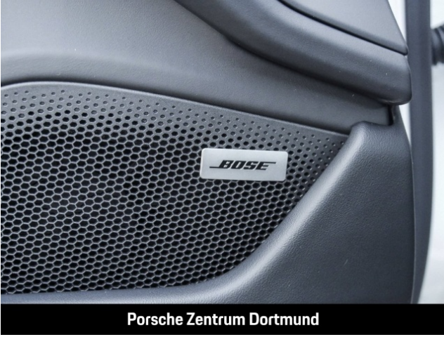
Porsche Zentrum Dortmund