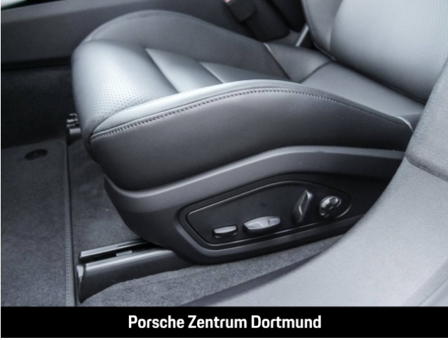
Porsche Zentrum Dortmund