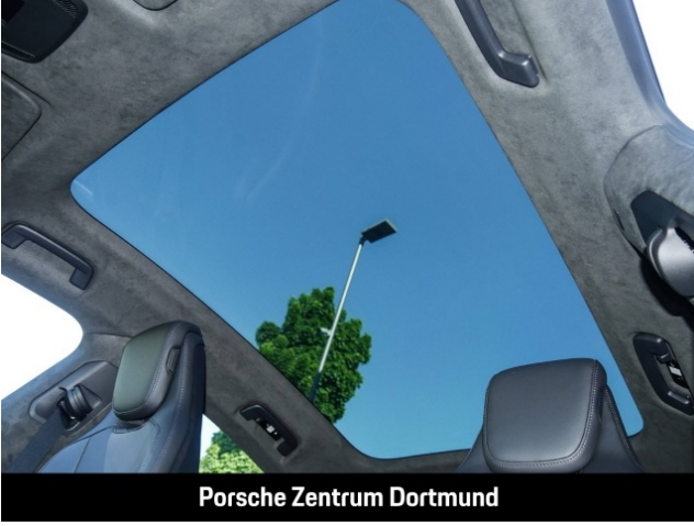
Porsche Zentrum Dortmund