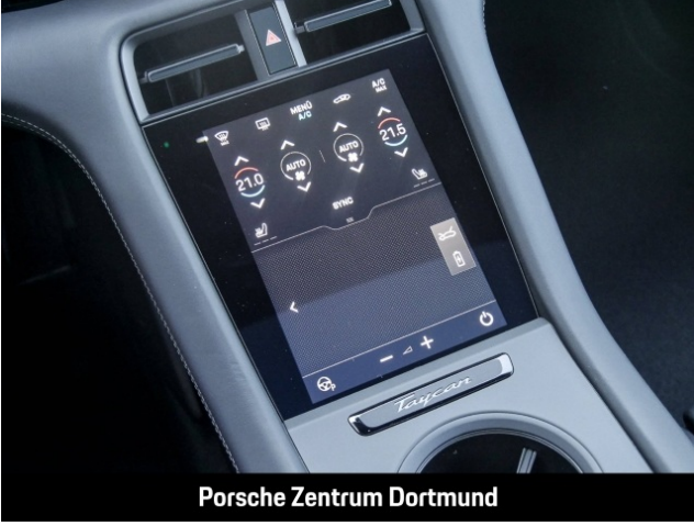
Porsche Zentrum Dortmund