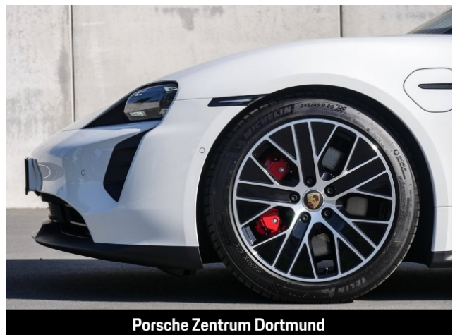
Porsche Zentrum Dortmund