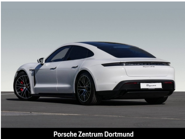
Porsche Zentrum Dortmund