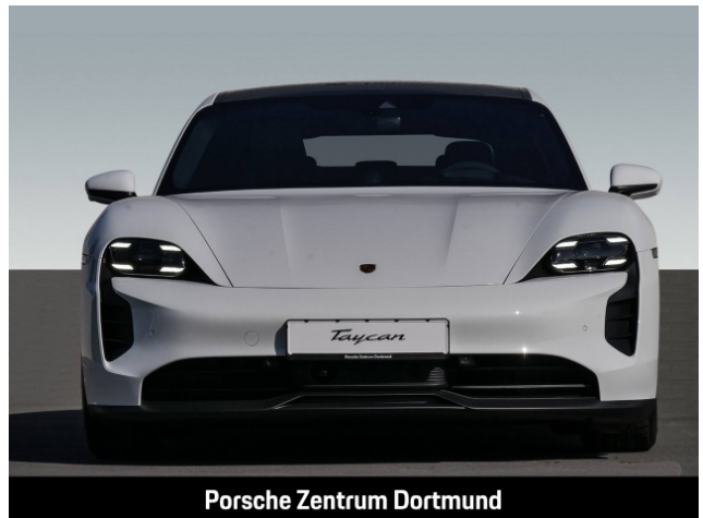
Porsche Zentrum Dortmund