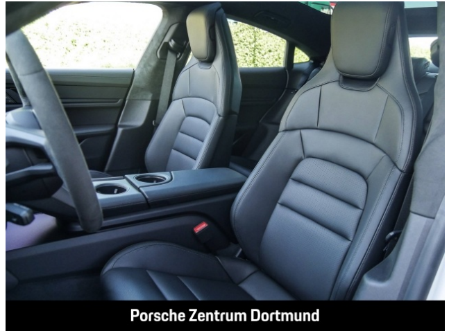
Porsche Zentrum Dortmund