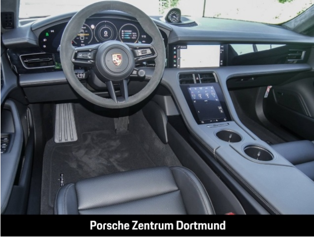
Porsche Zentrum Dortmund