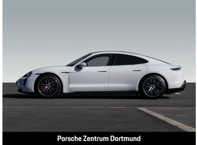
Porsche Zentrum Dortmund