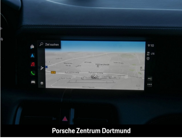
Porsche Zentrum Dortmund