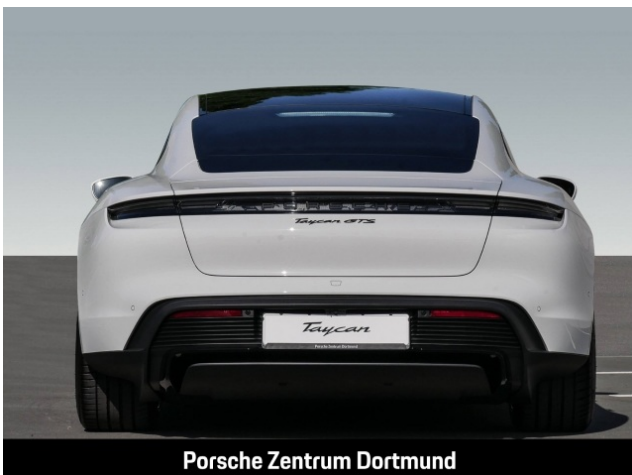
Porsche Zentrum Dortmund