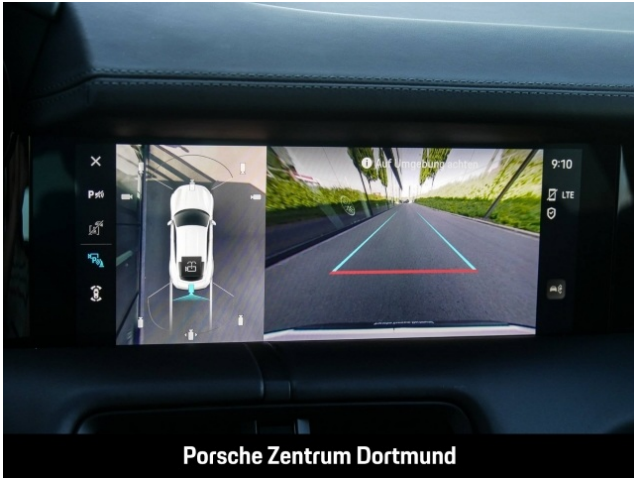
Porsche Zentrum Dortmund