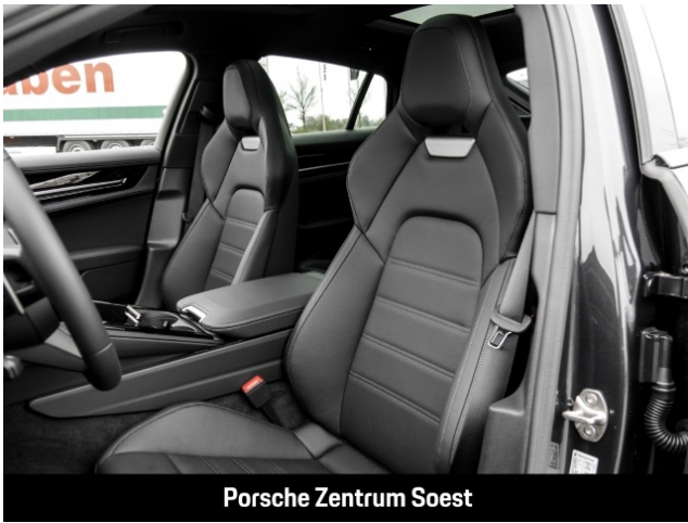
Porsche Zentrum Soest