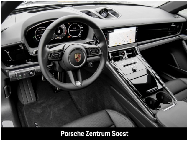
Porsche Zentrum Soest