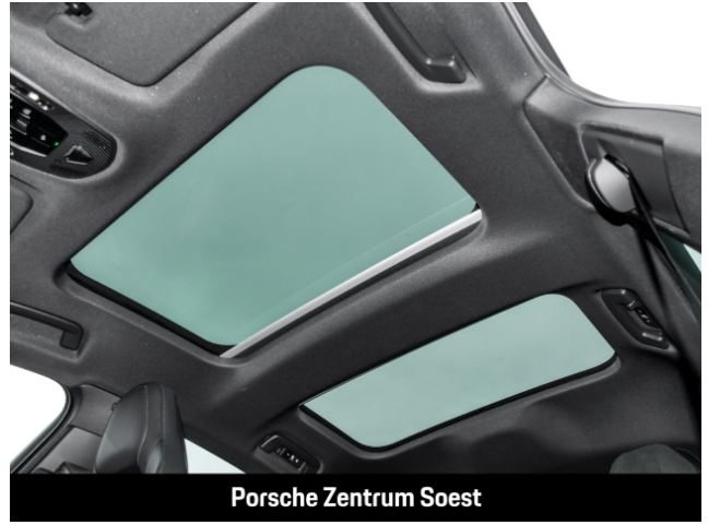
Porsche Zentrum Soest