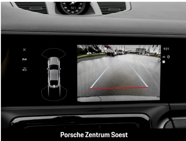
Porsche Zentrum Soest