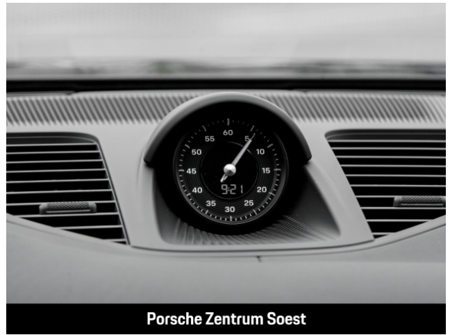
Porsche Zentrum Soest