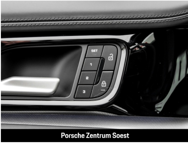
Porsche Zentrum Soest