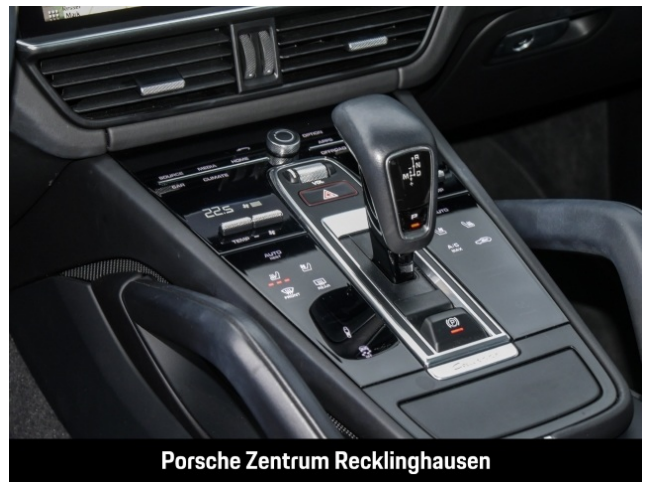
Porsche Zentrum Recklinghausen