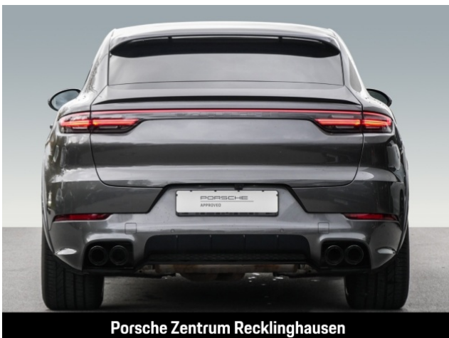
Porsche Zentrum Recklinghausen