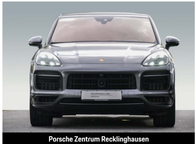
Porsche Zentrum Recklinghausen