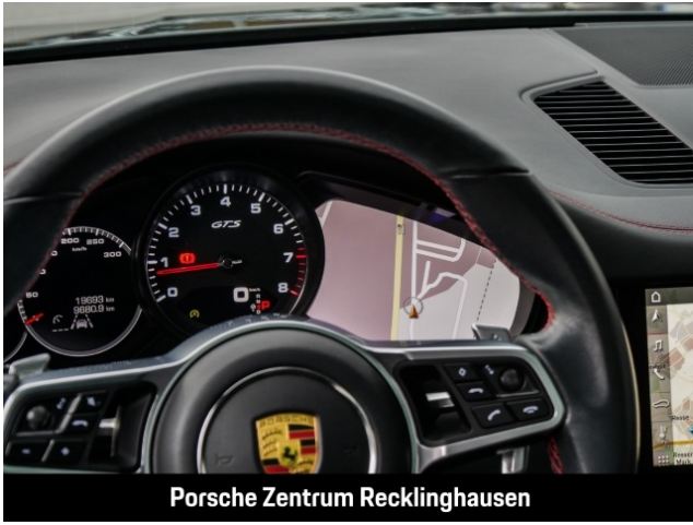
Porsche Zentrum Recklinghausen