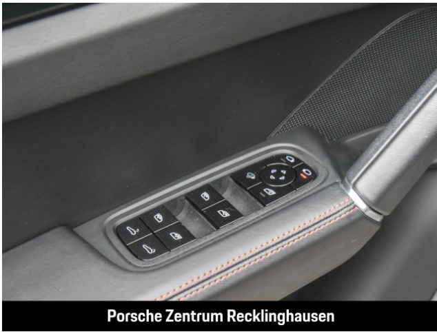
Porsche Zentrum Recklinghausen