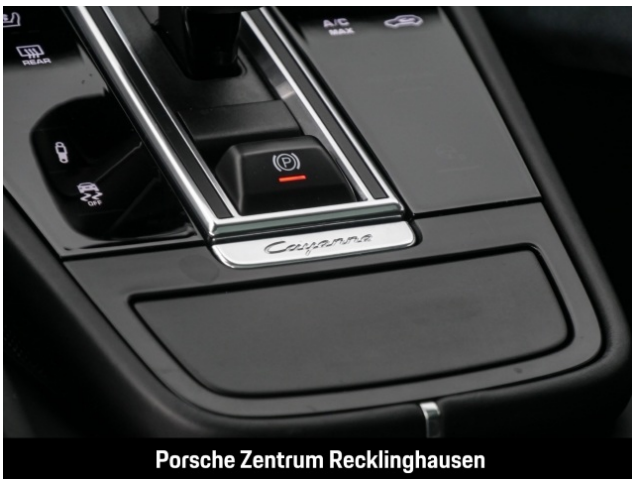
Porsche Zentrum Recklinghausen