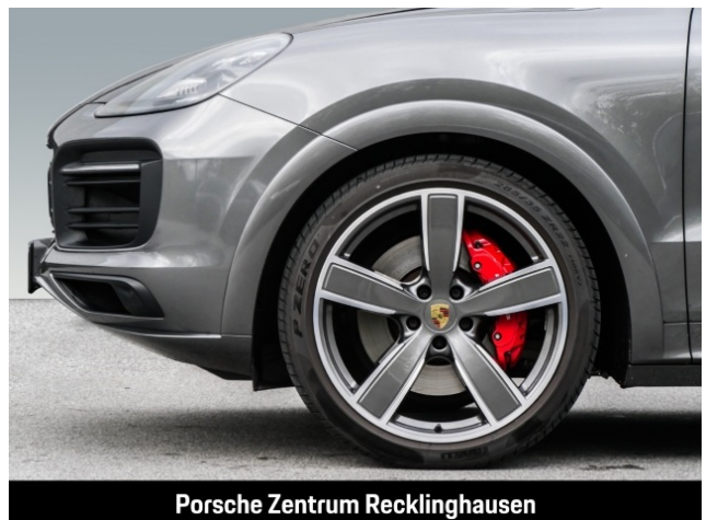
Porsche Zentrum Recklinghausen