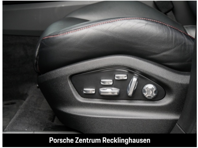
Porsche Zentrum Recklinghausen