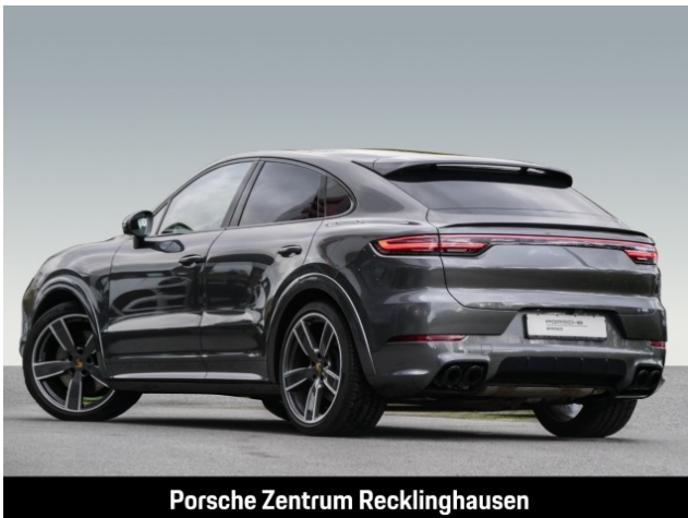
Porsche Zentrum Recklinghausen