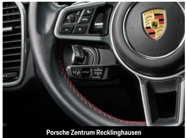
Porsche Zentrum Recklinghausen