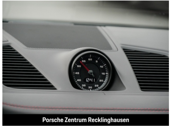
Porsche Zentrum Recklinghausen