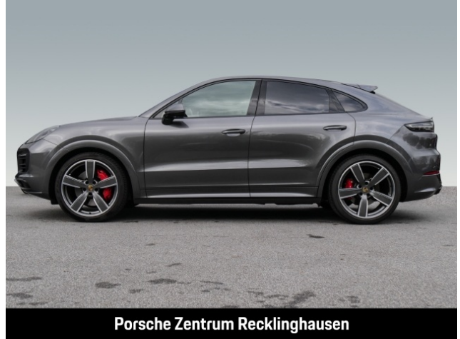
Porsche Zentrum Recklinghausen