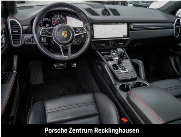
Porsche Zentrum Recklinghausen