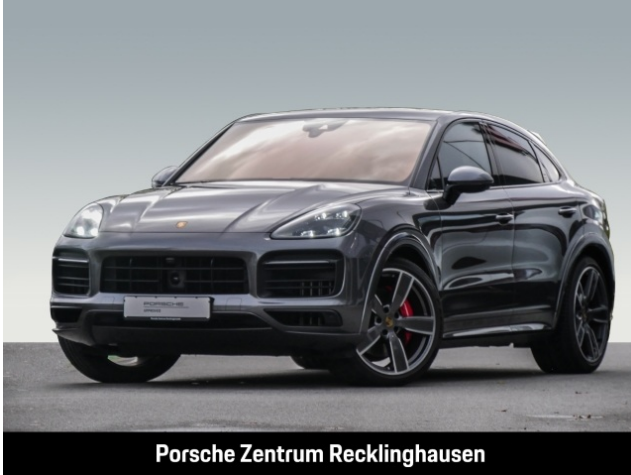
Porsche Zentrum Recklinghausen