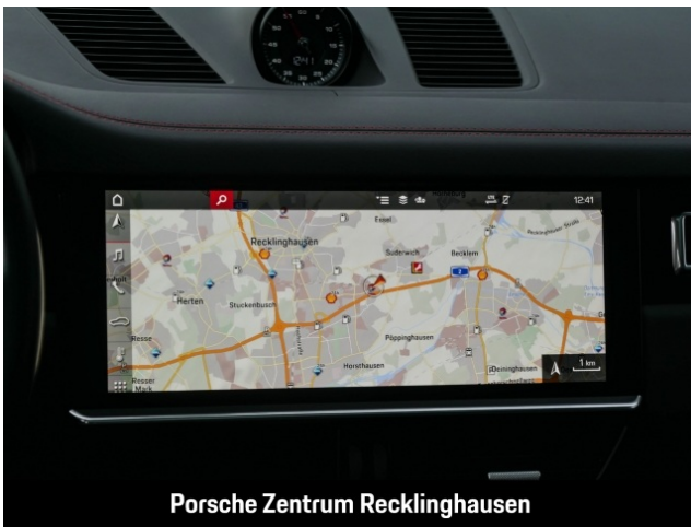
Porsche Zentrum Recklinghausen