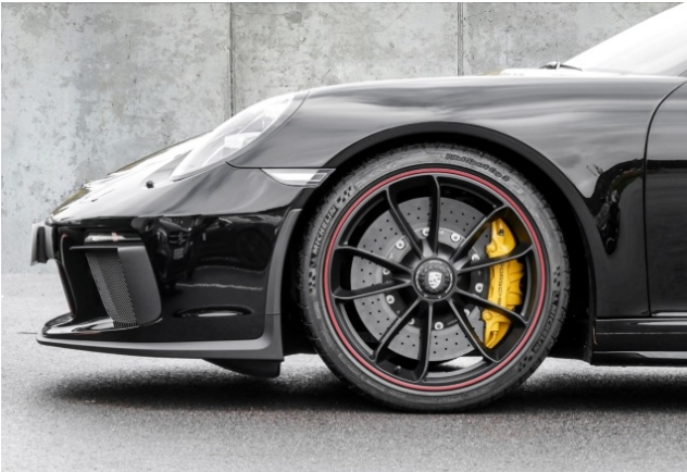
Porsche Zentrum Dortmund