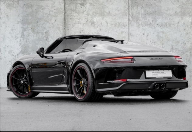
Porsche Zentrum Dortmund