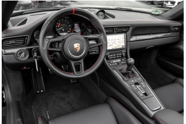
Porsche Zentrum Dortmund