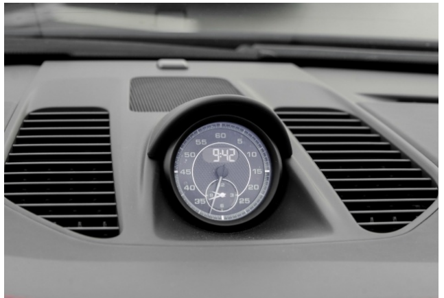
Porsche Zentrum Dortmund