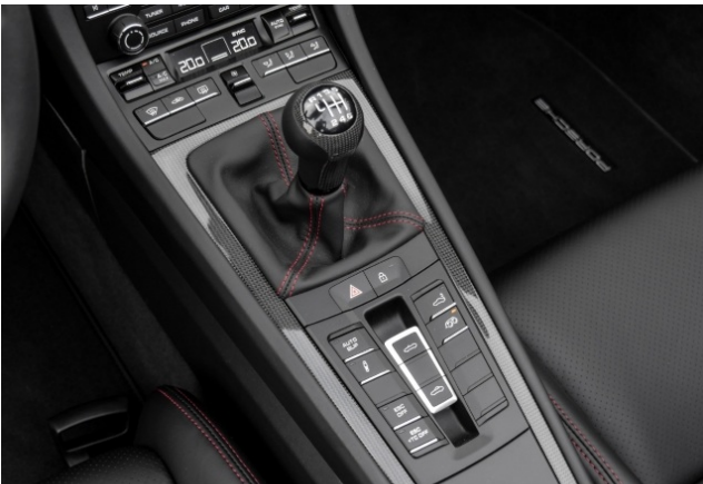
Porsche Zentrum Dortmund