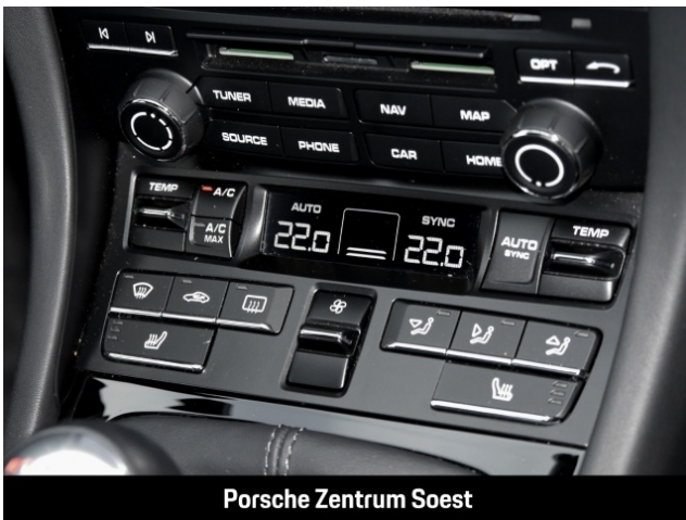
Porsche Zentrum Soest