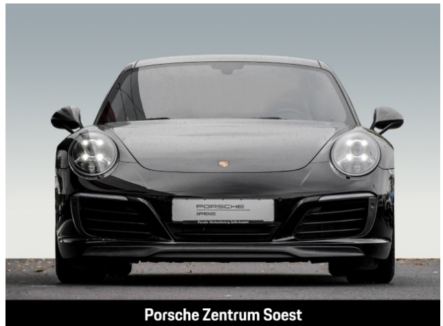
Porsche Zentrum Soest