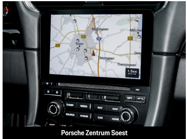
Porsche Zentrum Soest