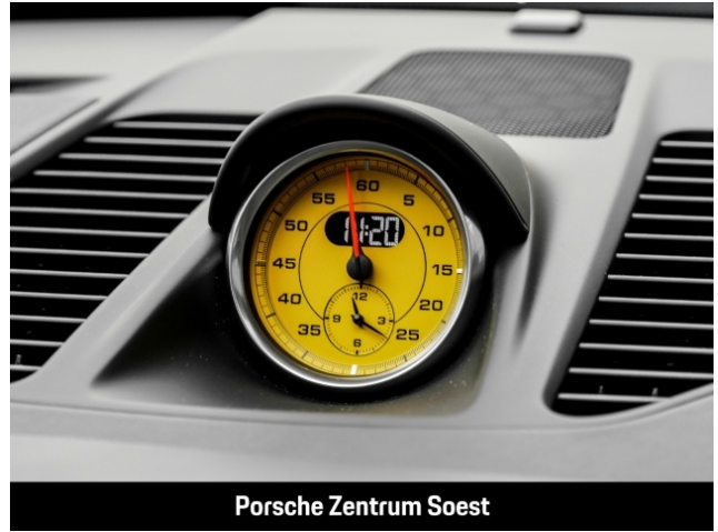
Porsche Zentrum Soest