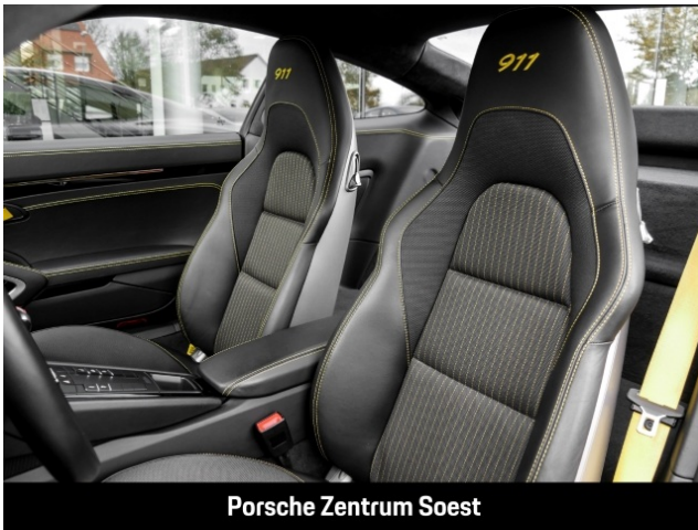
Porsche Zentrum Soest