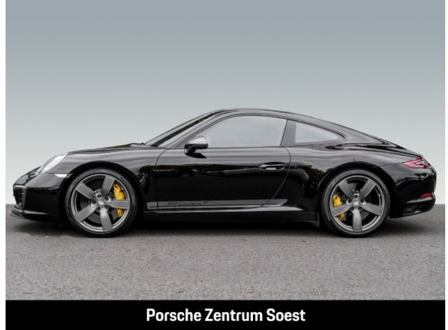
Porsche Zentrum Soest