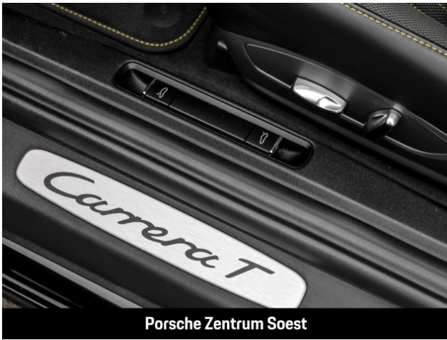
Porsche Zentrum Soest