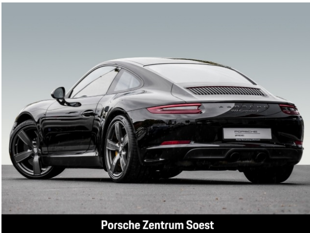
Porsche Zentrum Soest