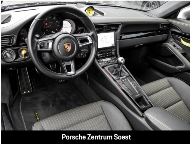
Porsche Zentrum Soest