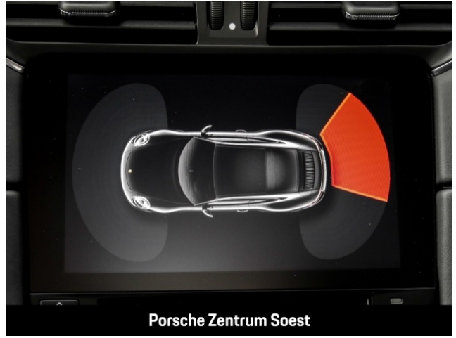
Porsche Zentrum Soest