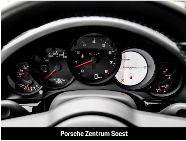
Porsche Zentrum Soest