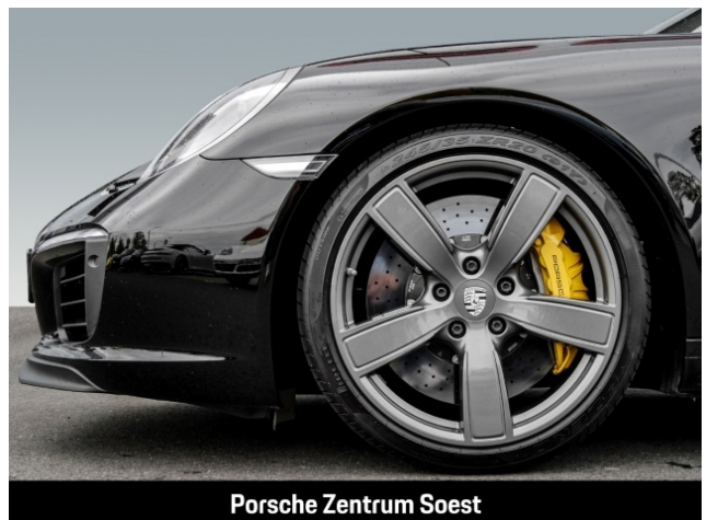
Porsche Zentrum Soest