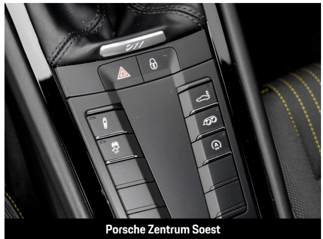
Porsche Zentrum Soest