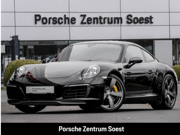
Porsche Zentrum Soest