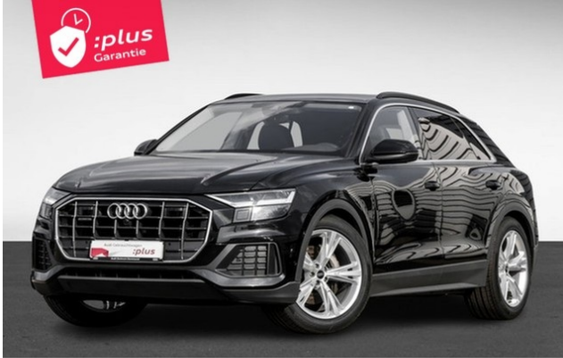
Audi Zentrum Dortmund