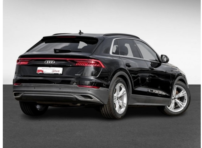
Audi Gebrauchtwagen :plus