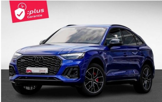
Audi Zentrum Dortmund