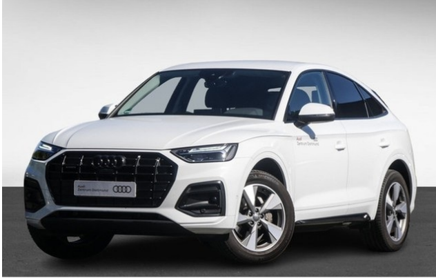
Audi Zentrum Dortmund