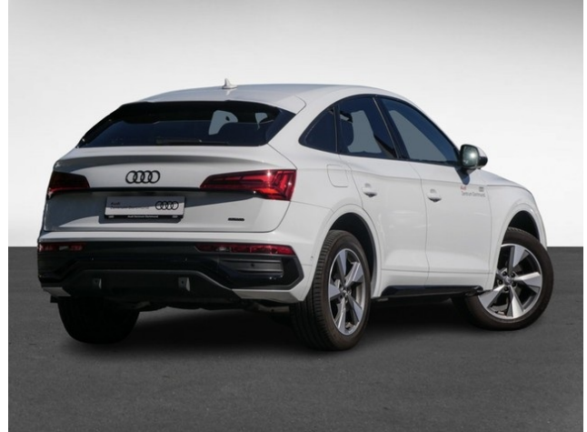
Audi Gebrauchtwagen :plus