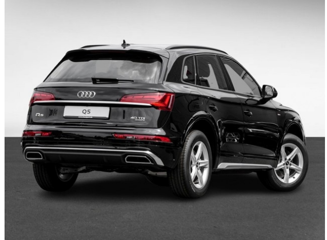
Audi Gebrauchtwagen :plus