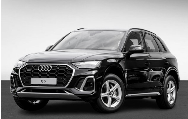
Audi Zentrum Dortmund