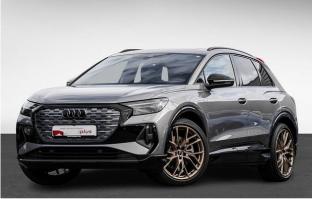
Audi Zentrum Dortmund