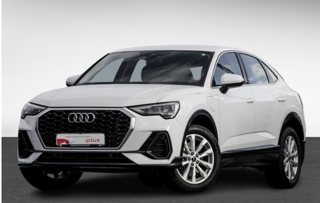
Audi Zentrum Dortmund