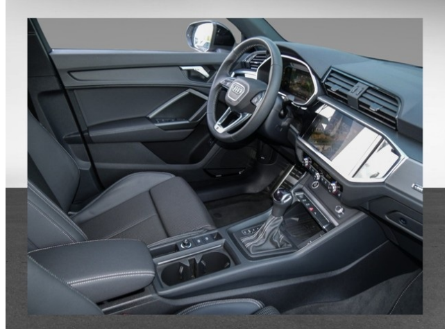
Audi Gebrauchtwagen :plus