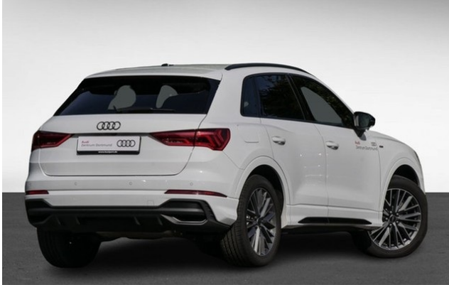
Audi Zentrum Dortmund