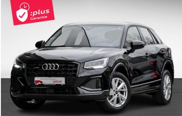
Audi Zentrum Dortmund