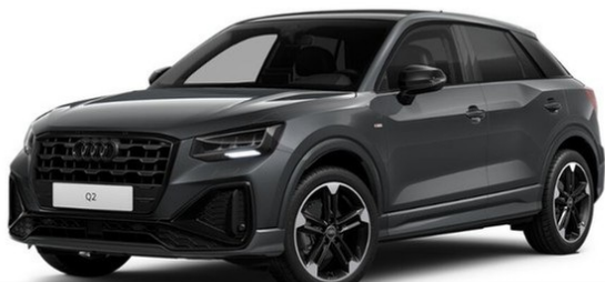
Audi Zentrum Dortmund