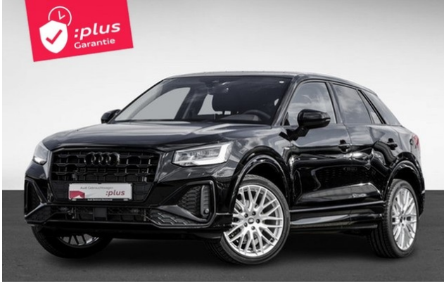
Audi Zentrum Dortmund