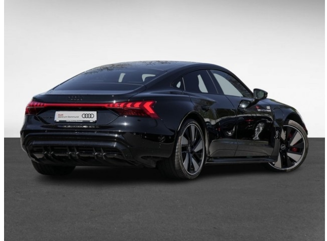
Audi Gebrauchtwagen :plus