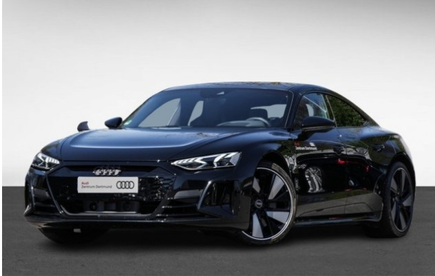
Audi Zentrum Dortmund