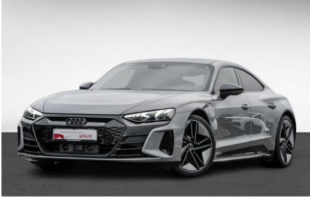
Audi Zentrum Dortmund