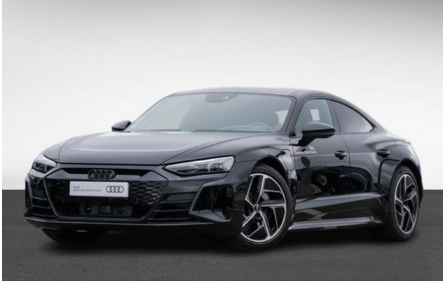
Audi Zentrum Dortmund