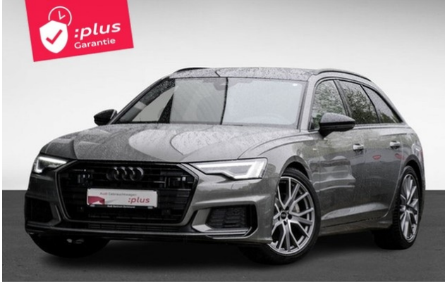
Audi Zentrum Dortmund