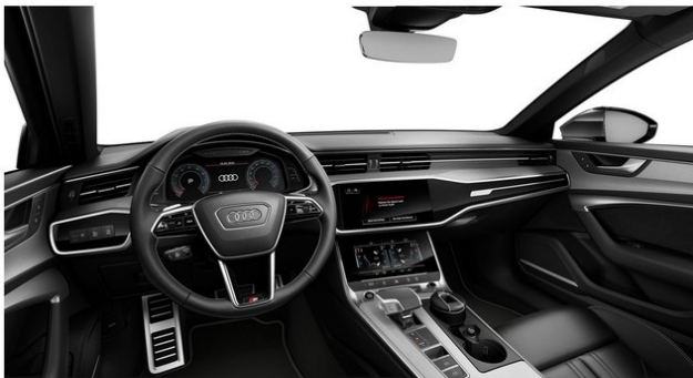
Technisch generiertes Bild: Tatsächlicher Zustand und Ausstattung können davon abweichen. Vergleichen Sie hierzu die Zustands- sowie Ausstattungsbeschreibung.