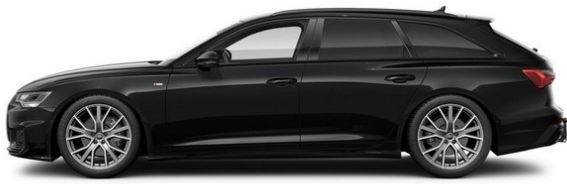
Technisch generiertes Bild: Tatsächlicher Zustand und Ausstattung können davon abweichen. Vergleichen Sie hierzu die Zustands- sowie Ausstattungsbeschreibung.