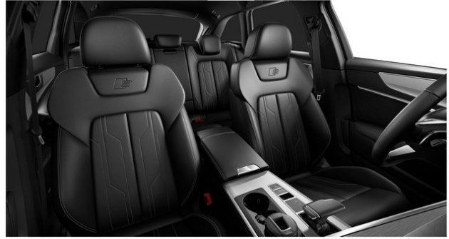
Technisch generiertes Bild: Tatsächlicher Zustand und Ausstattung können davon abweichen. Vergleichen Sie hierzu die Zustands- sowie Ausstattungsbeschreibung.