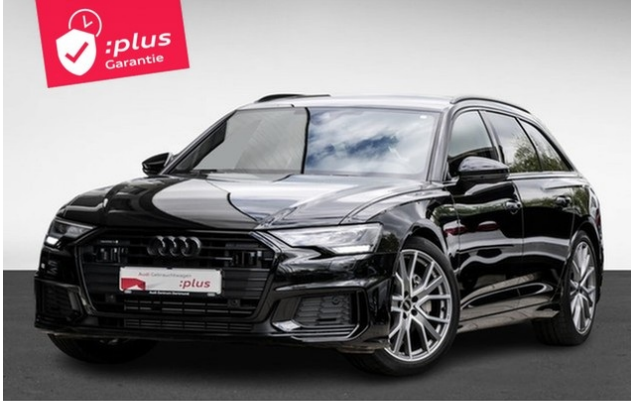
Audi Zentrum Dortmund