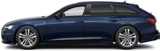
Technisch generiertes Bild: Tatsächlicher Zustand und Ausstattung können davon abweichen. Vergleichen Sie hierzu die Zustands- sowie Ausstattungsbeschreibung.