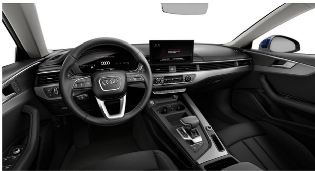
Technisch generiertes Bild. Tatsächlicher Zustand und Ausstattung können davon abweichen. Vergleichen Sie hierzu die Zustands- sowie Ausstattungsbeschreibung.