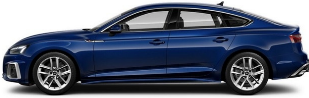
Technisch generiertes Bild. Tatsächlicher Zustand und Ausstattung können davon abweichen. Vergleichen Sie hierzu die Zustands- sowie Ausstattungsbeschreibung.