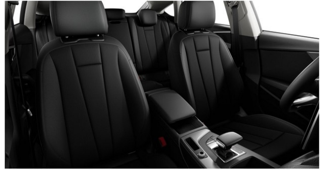
Technisch generiertes Bild. Tatsächlicher Zustand und Ausstattung können davon abweichen. Vergleichen Sie hierzu die Zustands- sowie Ausstattungsbeschreibung.