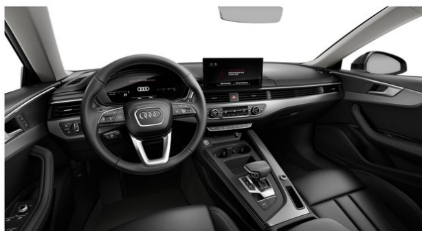
Technisch generiertes Bild. Tatsächlicher Zustand und Ausstattung können davon abweichen. Vergleichen Sie hierzu die Zustands- sowie Ausstattungsbeschreibung.