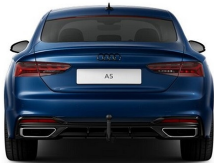
Technisch generiertes Bild. Tatsächlicher Zustand und Ausstattung können davon abweichen. Vergleichen Sie hierzu die Zustands- sowie Ausstattungsbeschreibung.