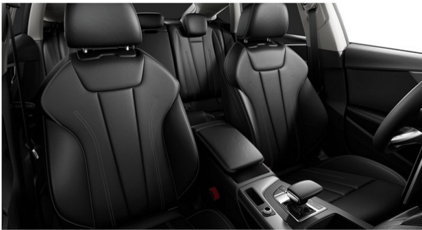
Technisch generiertes Bild. Tatsächlicher Zustand und Ausstattung können davon abweichen. Vergleichen Sie hierzu die Zustands- sowie Ausstattungsbeschreibung.