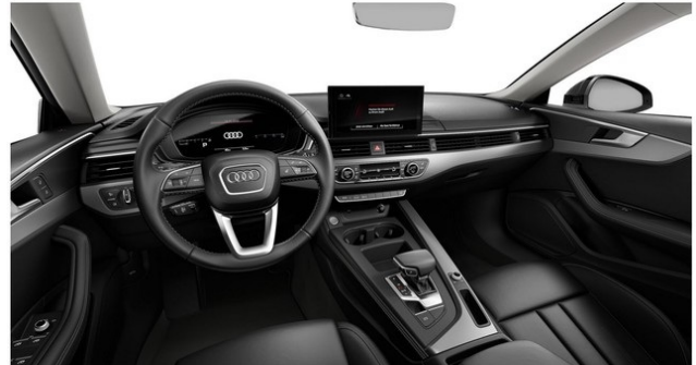
Technisch generiertes Bild. Tatsächlicher Zustand und Ausstattung können davon abweichen. Vergleichen Sie hierzu die Zustands- sowie Ausstattungsbeschreibung.