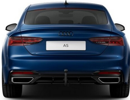
Technisch generiertes Bild. Tatsächlicher Zustand und Ausstattung können davon abweichen. Vergleichen Sie hierzu die Zustands- sowie Ausstattungsbeschreibung.