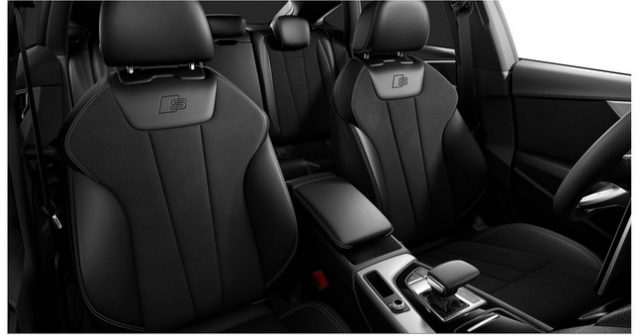
Technisch generiertes Bild. Tatsächlicher Zustand und Ausstattung können davon abweichen. Vergleichen Sie hierzu die Zustands- sowie Ausstattungsbeschreibung.