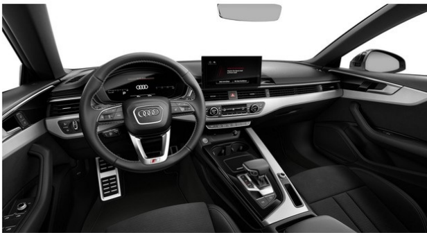
Technisch generiertes Bild. Tatsächlicher Zustand und Ausstattung können davon abweichen. Vergleichen Sie hierzu die Zustands- sowie Ausstattungsbeschreibung.