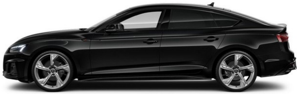
Technisch generiertes Bild. Tatsächlicher Zustand und Ausstattung können davon abweichen. Vergleichen Sie hierzu die Zustands- sowie Ausstattungsbeschreibung.