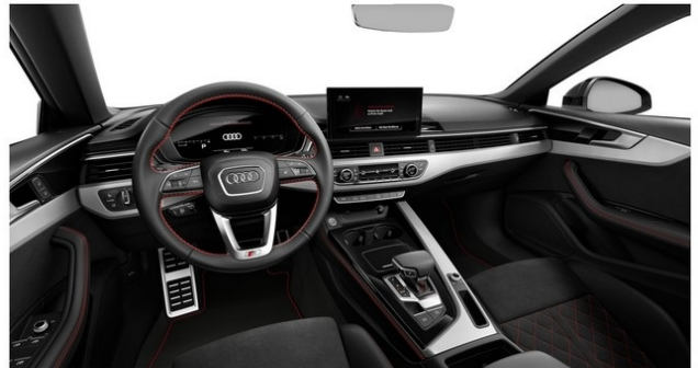
Technisch generiertes Bild. Tatsächlicher Zustand und Ausstattung können davon abweichen. Vergleichen Sie hierzu die Zustands- sowie Ausstattungsbeschreibung.