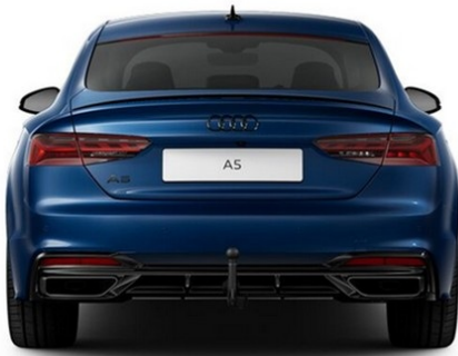
Technisch generiertes Bild. Tatsächlicher Zustand und Ausstattung können davon abweichen. Vergleichen Sie hierzu die Zustands- sowie Ausstattungsbeschreibung.