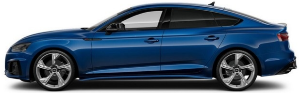
Technisch generiertes Bild. Tatsächlicher Zustand und Ausstattung können davon abweichen. Vergleichen Sie hierzu die Zustands- sowie Ausstattungsbeschreibung.