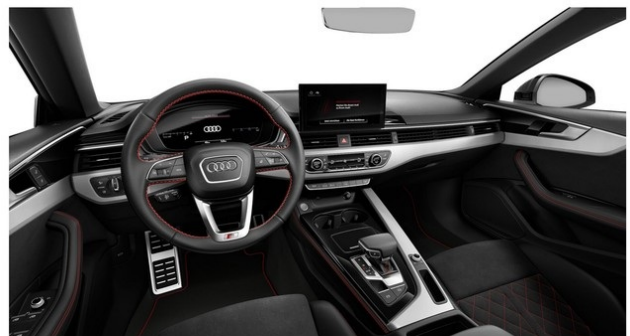
Technisch generiertes Bild. Tatsächlicher Zustand und Ausstattung können davon abweichen. Vergleichen Sie hierzu die Zustands- sowie Ausstattungsbeschreibung.