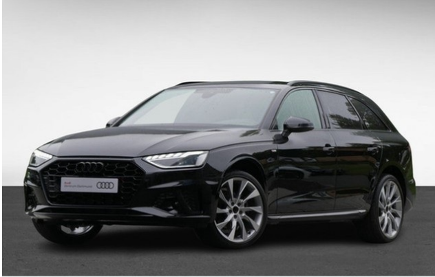
Audi Zentrum Dortmund